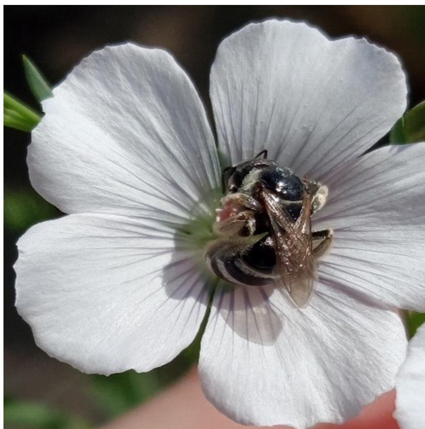
Рисунок 4 - Медоносная пчела ( Apis mellifera L.) на цветке льна DOI: https://doi.org/10.60797/JAE.2026.68.8.5

Начало цветения у сортов ВНИИМК 620 и Карабалыкский 7 было отмечено 20–25 мая. В период массового цветения льна на раскрытых цветках были зафиксированы особи обыкновенной медоносной пчелы ( Apis mellifera L.) (рис. 4).