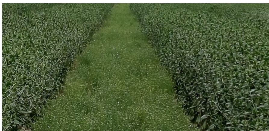
Рисунок 1 - Расположение одной родительской формы в условиях полевого стационара

Посев родительских форм был проведен 2 апреля семярядковой сеялкой СФК — 7, между рядами льна был высеван сафлор, сформировав так называемые кулисы (рис. 1).