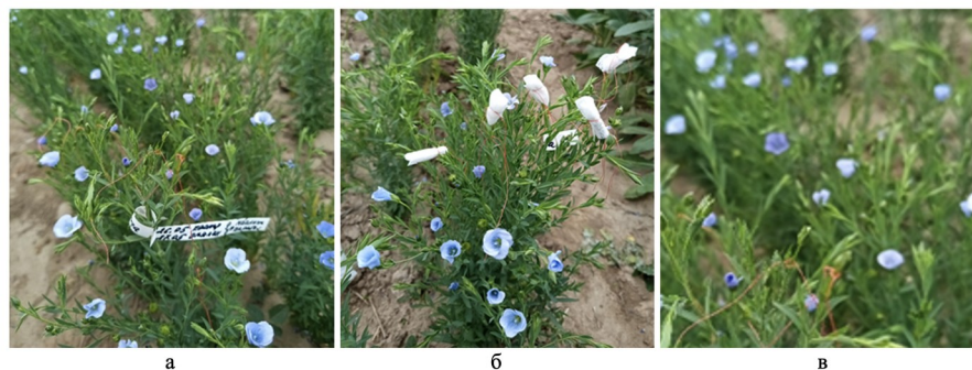
Рисунок 3 - Варианты опыта при гибридизации: а – без изоляции; б – с изоляцией; в – без кастрации и без изоляции и опыления (контроль) DOI: https://doi.org/10.60797/JAE.2026.68.8.4

3) кастрация/ без опыления/без изоляции (контрольный вариант) (рис. 3в).